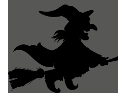
Illustrationen: pikabay (2)

Besonderheiten: Teilnahme ab zwölf Jahren; maximal 25 Personen